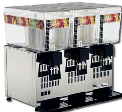
34 - 3 (3 bacs) Capacité 3 x 12 litres