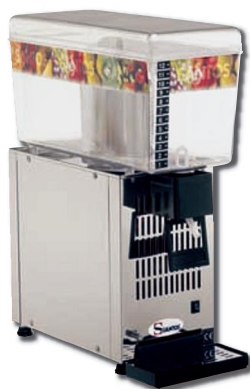
34 - 1 (1 bac) Capacité 12 litres capacity