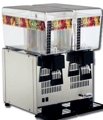
34 - 2 (2 bacs) Capacité 2 x 12 litres