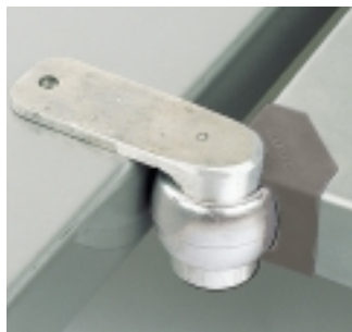
Montage en angle