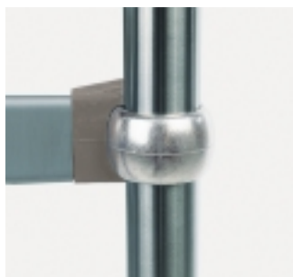
Serrage du collier